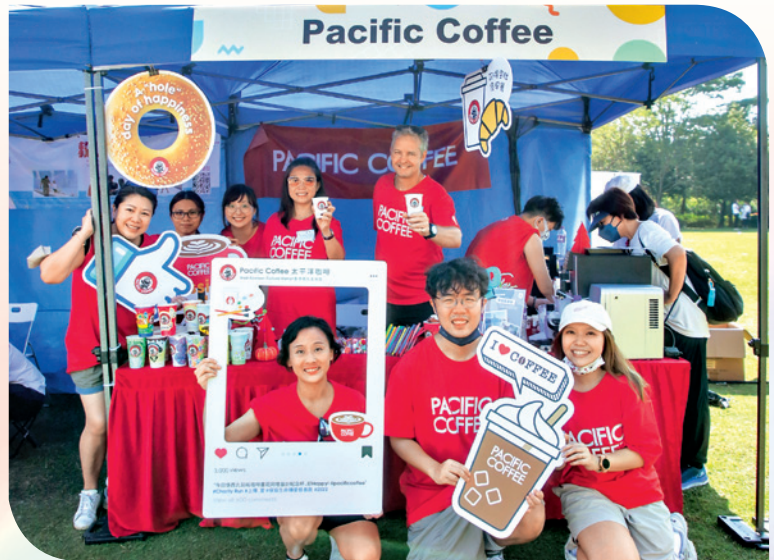
▲ Pacific Coffee團隊參與「全港保險愛心公益日」，身體力行，支持慈善。

『保協』聯絡並邀請我們一同舉辦慈善公益活動。」她讚揚「保協」為慈善、為籌款不遺餘力，除了活動的規劃和籌備工作十分詳盡和完善外，善款更會用作支持紅十字會、香港盲人體育總會及香港移植運動協會等機構，饒富意義。