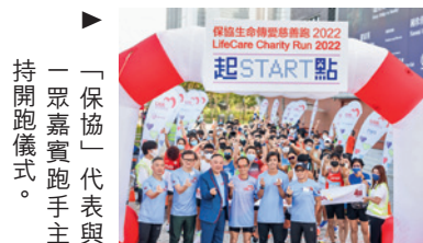
▶ 「保協」代表與一眾嘉賓跑手主持開跑儀式。

「保協生命慈善跑」今年再度於西九文化區舉行，同時邀得知名跑手陳家豪、視障跑手梁小偉以及傷健運動員「神奇小子」蘇樺偉一同參與。隨着賽事踏入第6屆，今年參賽人數超過1,600人，歷年累積人數已逾萬人，並為「保協慈善基金」及受惠機構籌得逾100萬港元善款。「保協生命傳愛慈善跑」特別嘉賓米雪讚賞一眾參加者的熱情，並鼓勵大眾多宣揚正面的運動精神，即使在疫情下也要經常鍛鍊身體。