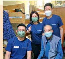
◀ 多家保險公司自組義工活動幫助弱勢社群。