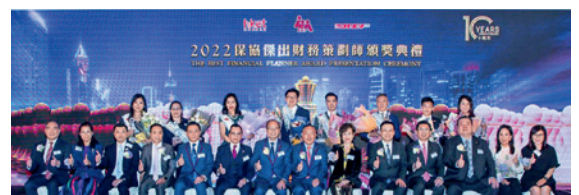
▲ 銀獎得獎者大合照。