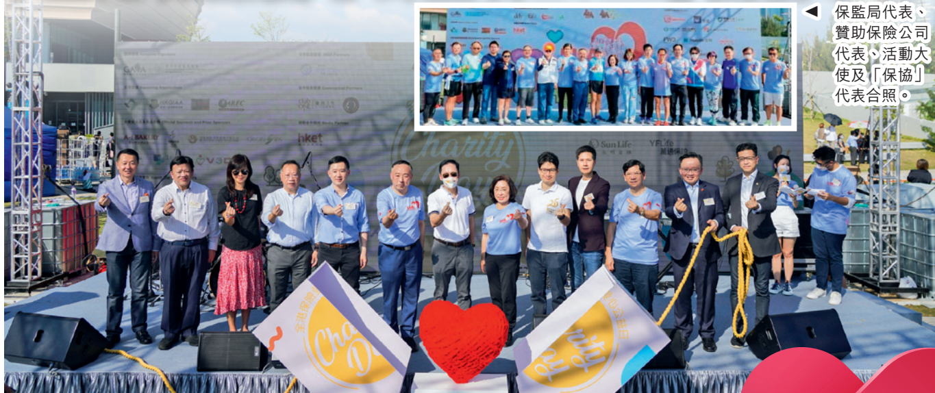
◀ 保監局代表、贊助保險公司代表、活動大使及「保協」代表合照。