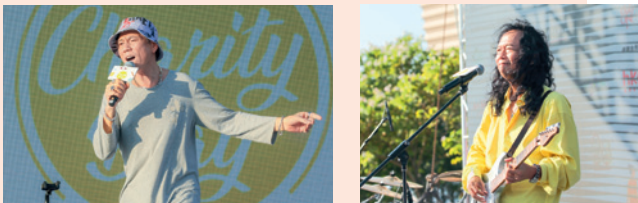
▲ 「慈善音樂嘉年華」邀得多名歌手出席。