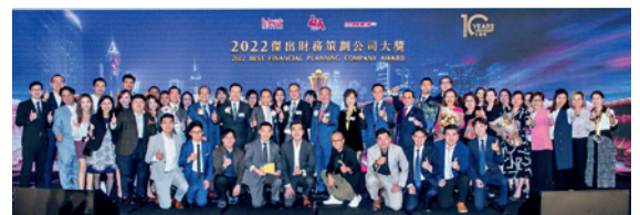
▲ 「2022傑出財務策劃公司大獎」由富衛人壽保險(百慕達)有限公司奪得。