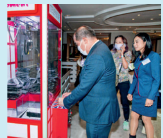
▲ 大會安排了遊戲和「打卡」位供畢業學員及來賓玩樂和拍照。