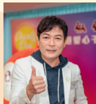
▶ 活動邀得藝人薛家燕（上）及歌手區偉麟（下）。