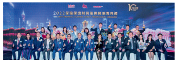
▲ 金獎得獎者大合照。