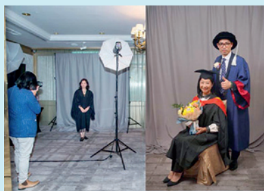
▲ 即場為畢業生拍攝專業畢業照。