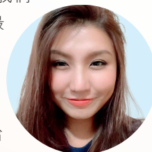
文章由陳頌然 (Dorothy) 提供

在生命難以預料的情況下，給予雪中送炭的援手，保險這個意義，潛藏着無比的愛和責任。這可能也是上天給予每位保險從業員和每位客戶的一種特殊且充滿溫度的緣份，而且緣起永不滅！