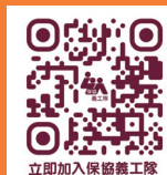
立即加入保協義工隊