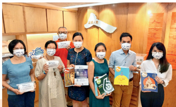
◀▲ 「保協慈善基金」代表與國際培幼會（左圖）及溫暖人間代表（右圖）合照。

多年來，「保協慈善基金」一直與本港不同類型的機構合作，透過彼此的平台讓更多人認識雙方的服務，包括「保協慈善基金」推廣的「保單捐贈計劃」，藉此讓合作機構的前線員工以至服務對象或客戶能了解該計劃的內容和詳情，從而考慮作出捐贈；亦讓保險業界認識相關機構的服務，在有需要時向客戶進行推廣。