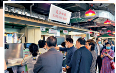
◀ 「保協」執委會租用「廚尊」場地舉行一次每月例會，身體力行支持社企。