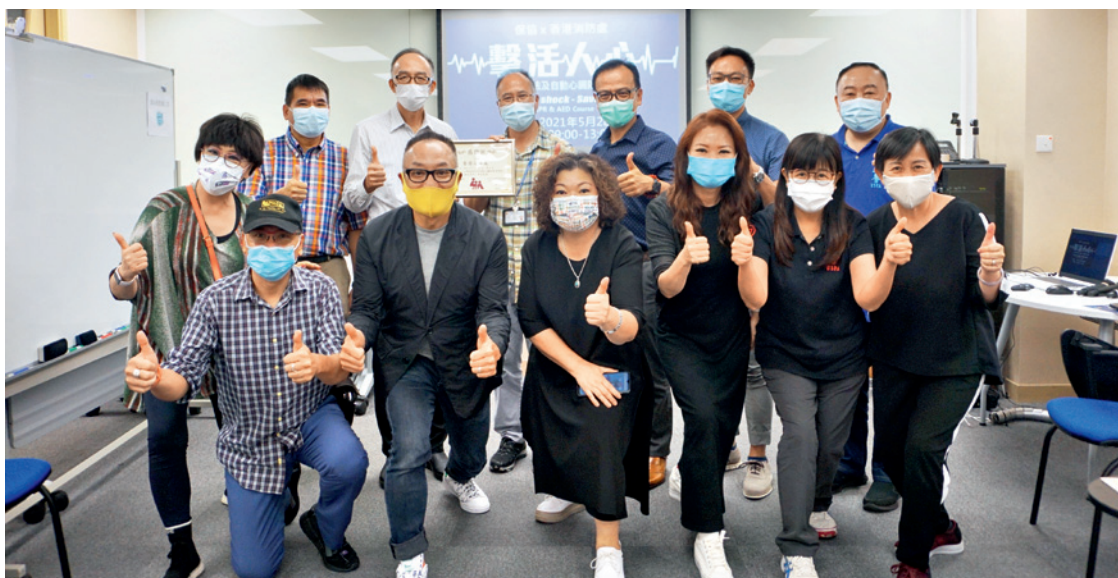
▲ 參加者與香港消防處代表合照。

新冠疫情的出現喚起大眾對健康衛生的關注，但除了疫情以外，大家日常亦可能面對很多危急的情況，例如在路上看到有人胸痛、心悸、不適暈倒，甚至失去意識，凡此種種均須大家即時的支援。為了讓同業掌握相關的急救知識，「保協」於今年5月特別與香港消防處合辦「擊活人心」心肺復甦法及自動心臟除顫器課程，讓更多人具備相關知識，有需要時救急扶危。