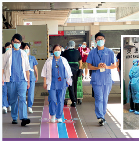
◀ 醫護人員及清潔工人走在前綫，保險公司為他們送上免費保障。

至於為感謝部分在疫情下仍堅守崗位的「高危人士」，包括醫護及清潔人員，不少保險公司亦為他們提供額外保障，部分更毋須預先登記，一旦確診或不幸因染疫而離世，即可獲得賠償，而相關保障金額高逾10萬港元。