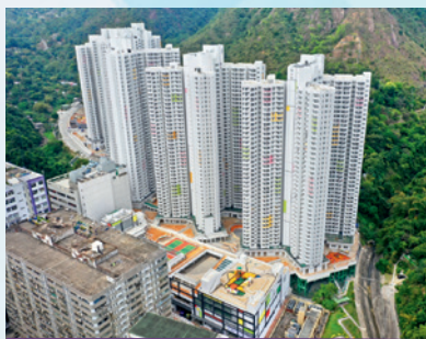
▲ 部分人士被安排入住火炭駿洋邨檢疫中心，隔離觀察。

由於新冠肺炎疫情的觀察、隔離時間，以至康復期相對一般傳染病較長，為免投保人因染疫而失去經濟來源，部分保險特別設有診斷賠償，當受保人被確診患上新冠肺炎後便可得到一筆過金額介乎1萬至10萬港元的賠償。