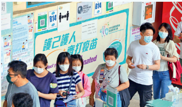
▲ 多家保險公司為大眾提供疫苗優惠或抽獎，鼓勵更多人接種疫苗。

為了令更多人受惠，相關保障甚至擴展至非客戶也能受惠。例如有保險公司便為18至55歲的市民提供住院保險。在優惠期內，市民只要到指定醫療中心接種認可的新冠疫苗，並在接種疫苗後2日內進行網上登記，即可獲得免費的住院現金保障；而個別保險公司更為使用其手機應用程式並作登記的市民，以及其18歲以下同住子女提供免費保障，將保障範圍延伸至客戶或登記人的家人。