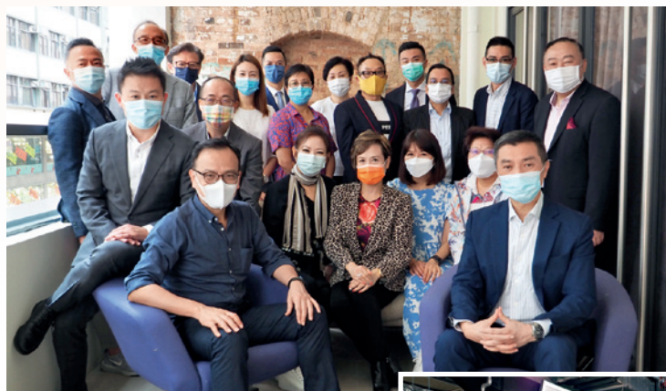
▲▶ 「保協」執委會成員了解「廚尊」的運作，並即場一嘗地道新加坡美食。

各位「保協」會員如有需要安排場地舉行會議或團隊活動，或有意參觀該社企之運作，可跟「廚尊」聯絡，並趁機一嘗新加坡地道美食！