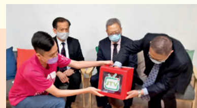
◀▲ 「保協慈善基金」及「生命傳愛行動」贊助「尊賢會」的節目，並向公眾介紹「保單捐贈」的詳情。