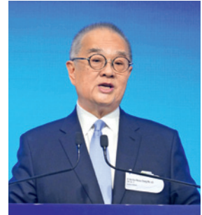
▲ 保險業監管局主席鄭慕智博士表示，業界自發地推出各種安排，着力減低投保人的負擔。

對於保險業界就疫情所作出的貢獻，保險業監管局主席鄭慕智博士曾表示，社會面臨困境的同時，正是保險業發揮它的「經濟減震器」和「社會穩定器」的關鍵時刻。「在疫情期間，業界自發地推出包括延長交付保費的寬限期、額外保障、特快索償處理程序等安排，着力減低投保人的負擔。單單在2020年的上半年，已經有超過14萬份延長寬限期的申請得到審批，涉及的保費接近100億港元。」