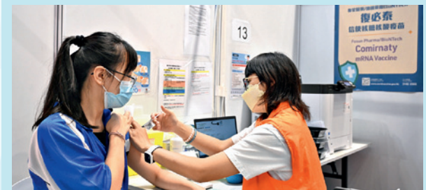
▲ 新冠疫苗接種計劃已經開展，但普遍市民關心疫苗引起的副作用以及相關醫療保障。