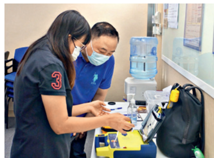
▲ 參加者模擬遇到突發情況，為假人施以心肺復甦法，並實習使用自動心臟除顫器。