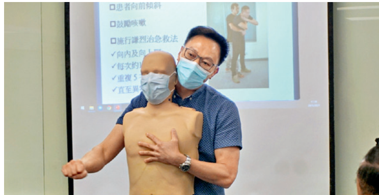
▲ 香港消防處代表向參加者簡介心肺復甦法，以及自動心臟除顫器的使用方法。

活動反應非常正面，更有不少會員要求再度舉辦！為協助推廣心臟驟停急救法，「保協」當然從善如流，已定於本年8月、10月及12月聯同香港消防處開辦更多相關課程，讓一眾會員學會相關知識，在必要時擔任「救心英雄」。此外，「保協」亦已在辦公室內增設心臟除顫器，藉此應付突發情況。