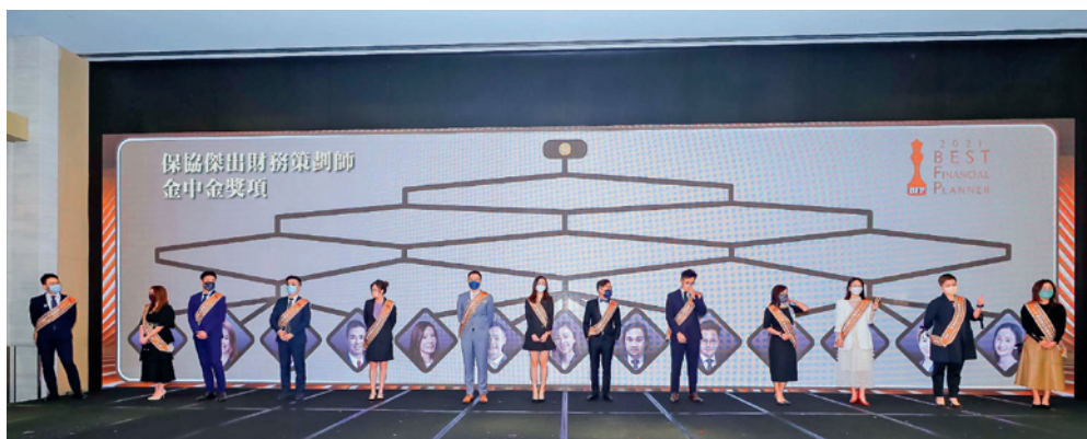
▲ 一眾金獎得主站在台上，大會以別開生面的畫鬼腳方式揭曉金中金獎項。