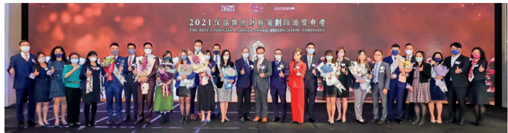
▲ 銀獎得獎者大合照。