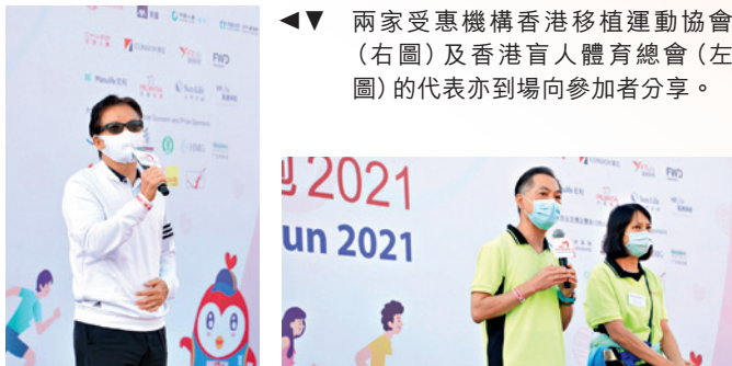
◀◀ 兩家受惠機構香港移植運動協會（右圖）及香港盲人體育總會（左圖）的代表亦到場向參加者分享。