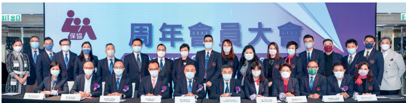
▲ 2021年度周年會員大會宣布的新一屆（2022年）執委會成員名單。