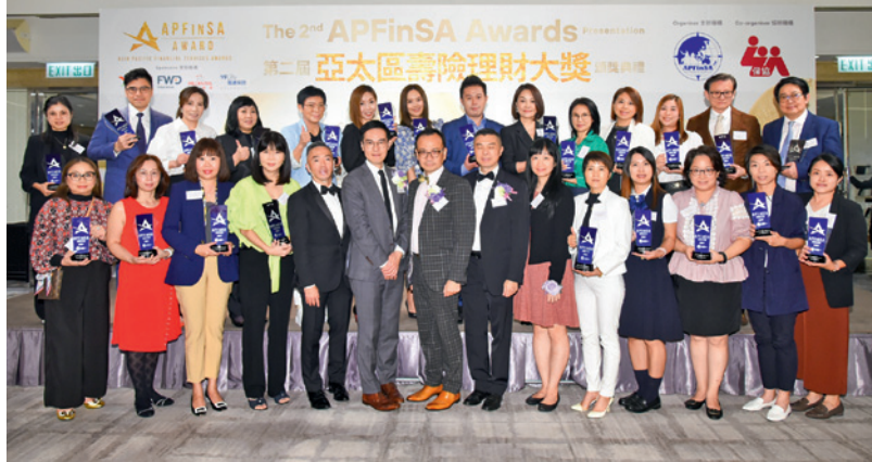
▲ 今屆「亞太區壽險理財大獎」得獎者與大會代表及頒獎嘉賓合照。

「保協」作為「亞太區財務策劃總會」（Asia Pacific Financial Services Association, APFinSA）的創會成員，除了開辦獲該會認可的「特許財務策劃師」（FChFP）課程外，去年更首次引入「亞太區壽險理財大獎」（APFinSA Awards），藉此表揚同業過去一年的努力。為嘉許一眾表現優秀的同業，協會於11月4日在尖沙咀朗廷酒店舉行頒獎典禮。