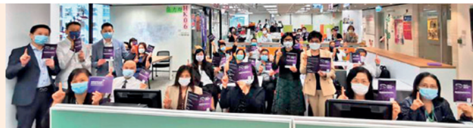
▲ 向團隊推廣後合照