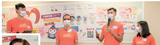
▲ 「保協生命傳愛慈善跑」啟動禮獲保險界、商界、社福界、體育界出席支持。圖為3位活動大使分享感受。