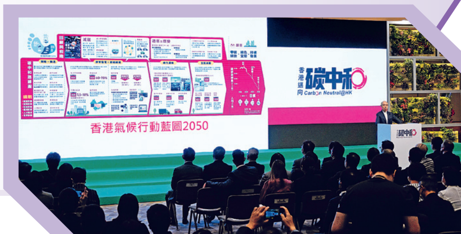
▲ 香港特區政府於今年10月發布《香港氣候行動藍圖2050》，提出連串減排措施，力爭在2050年實現碳中和的目標。

亞洲國家和地區的二氧化碳排放量屬於全球最高，展望未來，隨着近期多國公布實現淨零排放的目標以至時間表，承諾把經濟過渡至低碳模式，相信會為可持續發展領域的投資者帶來更多機會。同時，可再生能源是亞洲經濟體的另一個增長重點。因此，印度及其他東南亞國家和地區將不乏利好的投資機遇。投資者現時可留意再生能源、氣候變化及其相關的風險，預料會是一個長期投資的趨勢。