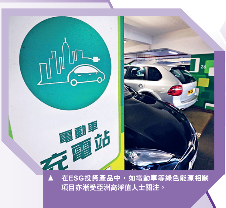
▲ 在ESG投資產品中，如電動車等綠色能源相關項目亦漸受亞洲高淨值人士關注。

早前，上市公司就ESG進行一項電子意見的調查，結果反映大多數企業認同在作出投資決定時會考慮企業的ESG因素。調查提到ESG已日漸成為投資股票的重要考慮因素。因此上市公司必須在ESG方面投入更大的關注度及更多資源，以回應市場的需求。在ESG中，最重視是社群關顧，反映企業管理必須「以人為本」，此乃商業重要的資產，秉持這些信念也有助推動社會共融。