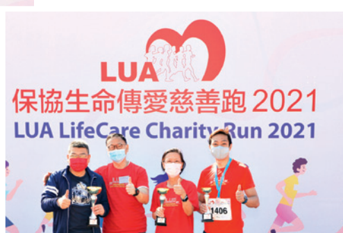
▲ 友邦保險（國際）有限公司贏得最高籌款獎。