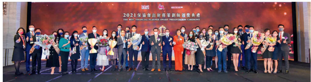
▲ 金獎得獎者大合照。