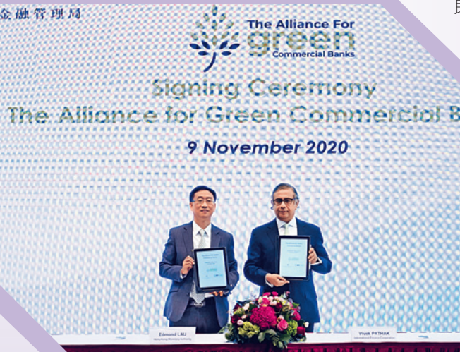
▲ 香港金融管理局（左）早前與國際金融公司（右）簽訂合作夥伴協議，共同應對氣候變化。