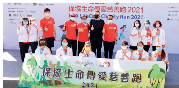
▲ 活動獲得多間商業機構贊助，不少更派隊參與。