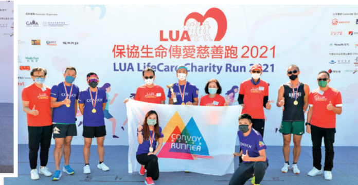
▲ 康宏理財服務有限公司贏得「4x1團隊接力賽」冠軍。