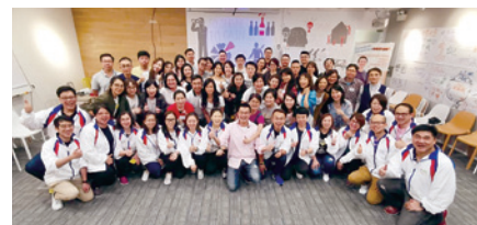
▲ 課程採用互動、體驗式的學習模式，讓學員可一起扶持，實現目標。