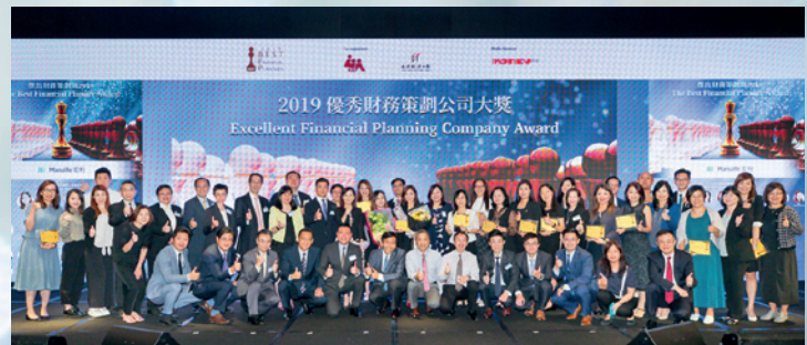
▲ 宏利人壽保險（國際）有限公司榮獲2019優秀財務策劃公司大獎。