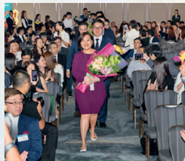
▲ 眾金銀獎得主儀仗進場，接受全場掌聲祝賀。