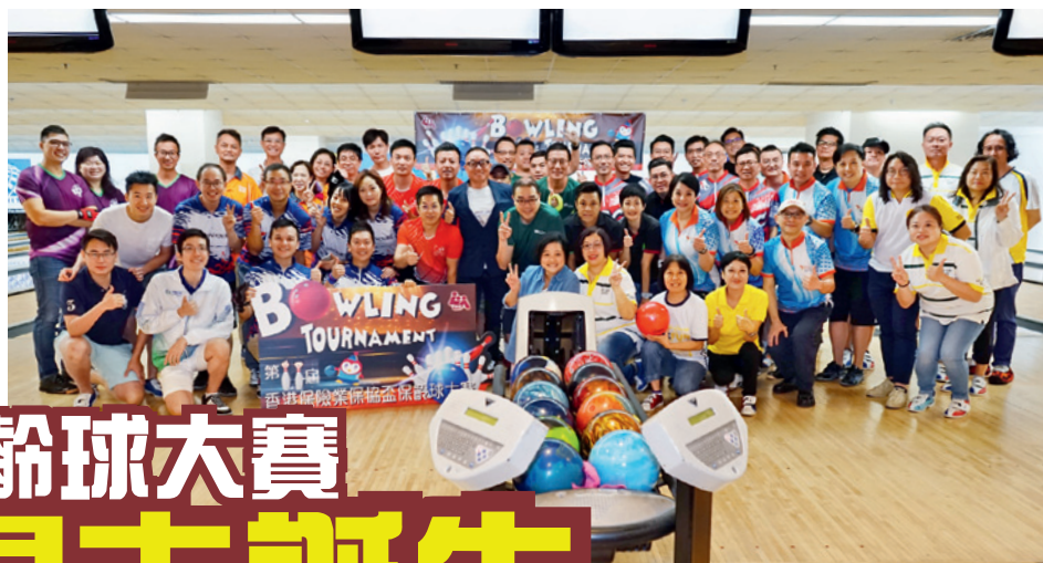
▲ 一眾參加者大合照。

「保協」於9月21日假奇樂保齡天地舉行「第十一屆香港保險業保協盃保齡球大賽」。今年共有54名來自不同保險公司的從業員，組成18支隊伍，競逐11個獎項。