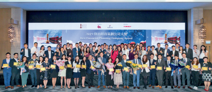
▲ 富衛人壽保險（百慕達）有限公司榮獲2019傑出財務策劃公司大獎。