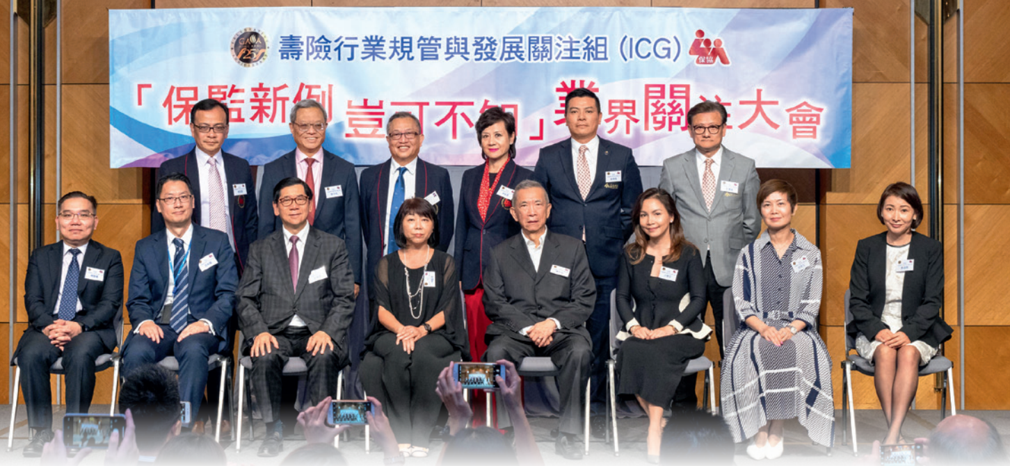
▲ 保監局代表與ICG代表於大會開始前合照。

保險業監管局（下稱「保監局」）已於2019年9月23日起，正式接管所有業界的法規與監管的工作，並制定了一系列的法則，對同業有莫大影響。為此，由「保協」及「香港人壽保險經理協會」組成的「壽險行業規管與發展關注組」（下稱「ICG」），特別於今年8月30日召開「保監新例 豈可不知」業界關注大會，與業界分享有關的詳情。