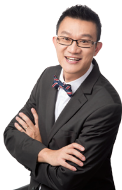
▲ Everest多年來曾助不少學員成功實現財務自由。