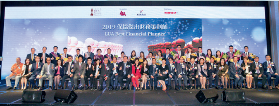
▲ 2019年度金、銀獎得主與主禮嘉賓、公司代表及「保協」代表大合照。