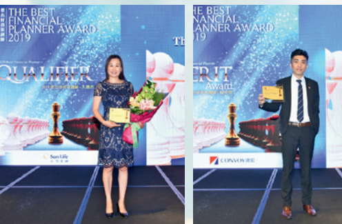
▲ 大會特別安排入選者及優異獎得主上台獨照。