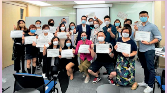
▲ 6月份課程剛結束，祝學員們學有所成！