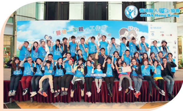
香港聾人子女協會透過不同活動支援聾人家庭。

在聾人和健聽人士之間，有一個特別的群體——聾人子女「CODA」(Children of Deaf Adults)。他們夾在聾人和健聽人士之間，遊走於無聲和有聲的世界，成長無疑會遇到不少挑戰，而香港聾人子女協會自成立起一直支持CODA的成長發展、促進聾人家庭和諧，以及推動社會聾健同行的文化。